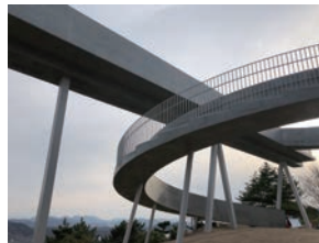
尾道千光寺展望台「PEAK」©青木淳